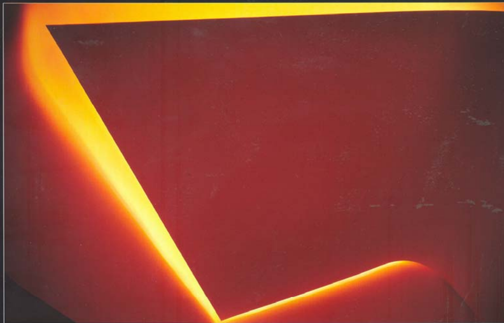
Desaparecen las aristas donde se encuentran los planos curvos y se sustituyen por líneas de luz indirecta, de diferente color según el acto que se realice en la capilla